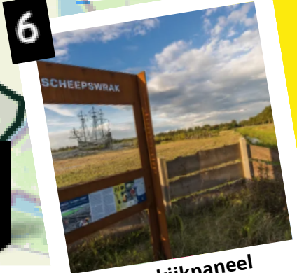
6 Doorkijkpaneel Scheepswrak