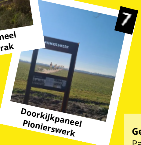
7 Doorkijkpaneel Pionierswerk