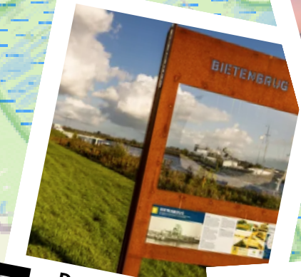
3 Doorkijkpaneel Bietenbrug