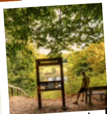
4 Doorkijkpaneel Kuinderburcht