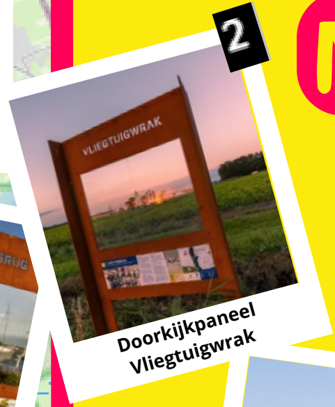
2 Doorkijkpaneel Vliegtuigwrak