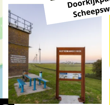
8 Doorkijkpaneel Pionierswerk