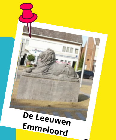
De Leeuwen Emmeloord